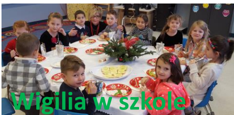
Wigilia w szkole