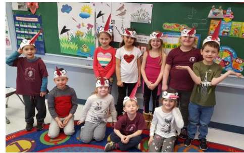
Wiosna tuż, tuż ...