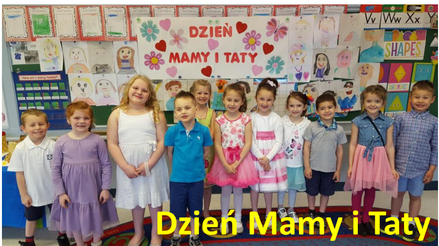
Dzień Mamy i Taty